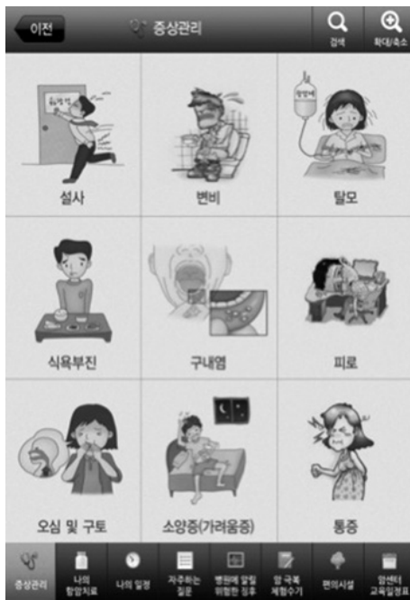
Figure 3. Screen of Symptom management

나의 일정관리 메뉴는 주민등록번호 입력 또는 QR 코드를 인식하는 방식으로 로그인 한 뒤 사용이 가능하며 개인의 항암치료, 외래, 검사 일정 등을 달력 형식으로 한눈에 볼 수 있도록 하였다. 또한 중요한 사항이나 혈액 검사 등을 메모할 수 있는 기능도 갖추고 있다(Figure 4). 항암제 정보 메뉴 화면에는 총 37가지의 항암제가 나열되어 있으며 항암제의 상품명과 성분명 두가지 모두 표기되어 있다. 항암제의 이름을 터치해서 들어가면 해당 항암제에 대한 주요 부작용이 나오고 관심 있는 부작용을 터치해서 들어가면 부작