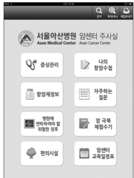
Figure 2. Main screen of mobile App

암환자를 위한 모바일용 네비게이션프로그램은 스마트폰을 통하여 애플 앱스토어, 티스토어, 플레이스토어(구글)등을 통하여 다운로드 가능하며 해당 아이콘을 터치하면 초기 화면이 뜨고, 첫 화면이 사라지게 되면 메인 화면에 증상관리, 나의 일정관리, 항암제 정보, 자주하는 질문, 병원에 연락하여야 할 위험한 징후, 암 극복 체험수기, 편의시설, 암센터 교육일정표의 총 8가지의 상부 콘텐츠가 나열되어 있다 (Figure 2). 콘텐츠는 전체 130페이지로 구성되어 있다. 모든 화면의 상단에는 검색 기능과 화면 확대 축소 기능이 있어, 찾고 싶은 정보를 연관 단어로 쉽게 검색하여 해당 콘텐츠로 이동하게 하였으며 작은 글씨는 확대하여 볼 수 있도록 하여 높은 연령대에서도 사용하기 편리하게 하였다.