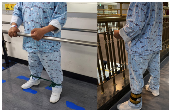
Figure 1. Side walking training

측방보행 훈련은 환자 안전과 정확한 측방보행 훈련이 진행될 수 있도록 353cm의 평행봉과 5m의 난간이 있는 장소에서 진행하였다. 대상자는 수직방향으로 몸통, 골반, 무릎관절 신전(extension)이 될 수 있도록 평행봉 안에 바르게 기립할 수 있도록 하였다. 훈련 중 마비측 무릎 관절이 다 펴지지 않는 환자는 무릎을 펴서 고정할 수 있는 스트랩을 사용하였다. 대상자는 측방으로 이동하여 발을 딛고 다음 발이 옆으로 갈 수 있도록 하였으며, 이때 발이 수평으로 이동될 수 있도록 하였고, 시선은 전방을 주시하도록 하여 몸통이 굴곡되는 않도록 하였다[11-13]. 이런 자세는 보행 훈련 중 중둔근과 소둔근이 최대로 활성화될 수 있는 고관절의 자세 정렬이 요구되기 때문이다. 훈련 시 환자 안전을 위해 치료사나 보호자 중 1명이 동반할 수 있도록 하였고, 추가적 안전을 위해 허리에 안전벨트를 착용하여 낙상에 대비할 수 있도록 하였다. 훈련 시간은 준비 운동 5분, 마비측과 비마비측 방향으로 이동하는 훈련을 20분 실시하였으며, 휴식시간은 5분으로 총 30분 실시하였다. 측방으로 이동하는 발의 넓이는 바르게 선 자세에서 편안하고 균형을 유지할 수 있을 정도로 하였으며, 훈련의 강도는 운동자각도를 이용하여 13(약간 힘들다) ~ 15(힘들다)로 하였다. 적절한 훈련의 강도를 위해 모래 주머니를 마비측 발목에 부착하거나 탄성밴드를 이용해 설정하도록 하였다(Figure 1)[15].